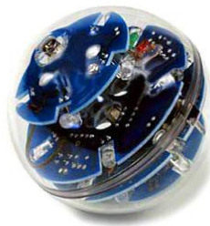
شکل ۱ - نمونه شکل داده شده

نمودار در زیر آمده است: (توجه شود که شکل‌ها و نمودارها نیز، همانند جدول‌ها باید در موقعیت وسط‌چین نسبت به طرفین کاغذ و در جداولی با خطوط بی رنگ مطابق زیر قرار گیرند.)